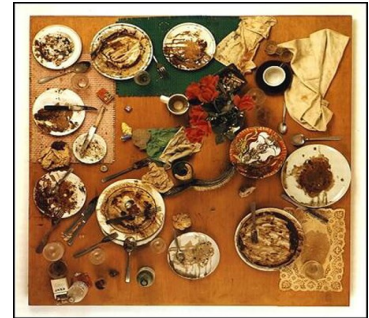
Daniel Spoerri : table-piège , 1963

Ce tableau est une vanité : il symbolise le temps qui passe, la mort qui s'approche et l'inutilité des plaisirs, des richesses, de l'amour de la beauté et de la jeunesse... C'est une peinture moralisante.