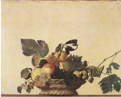
Caravage : Corbeille de fruits 1594-1602